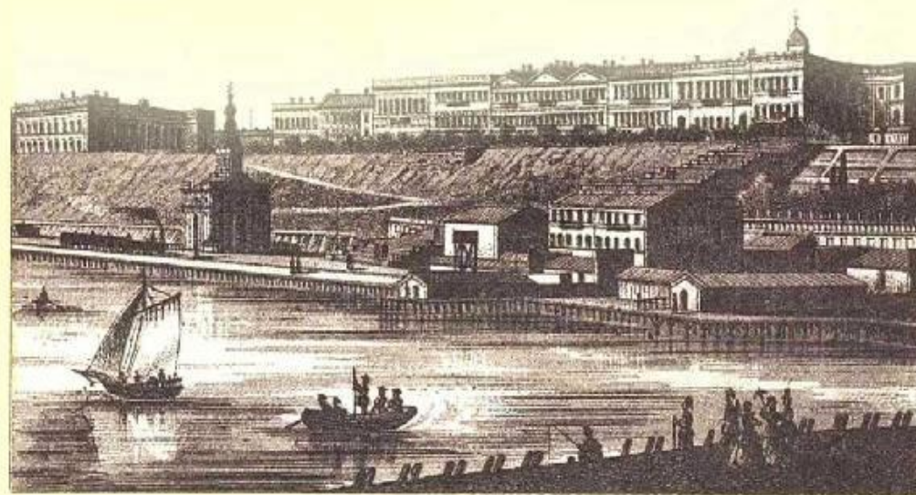
Видъ Бульвара съ моря