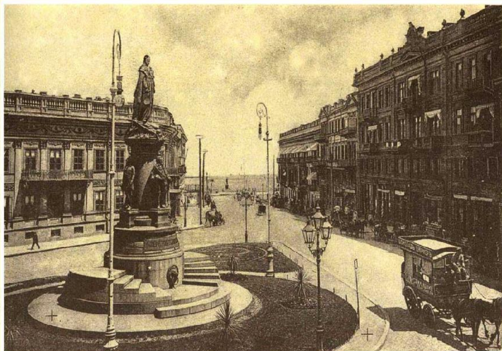
Памятникъ Екатерины II и видъ на Николаевскій бульваръ. Monument à Catherine II et vue sur le boulevard Nikolaïevsky.